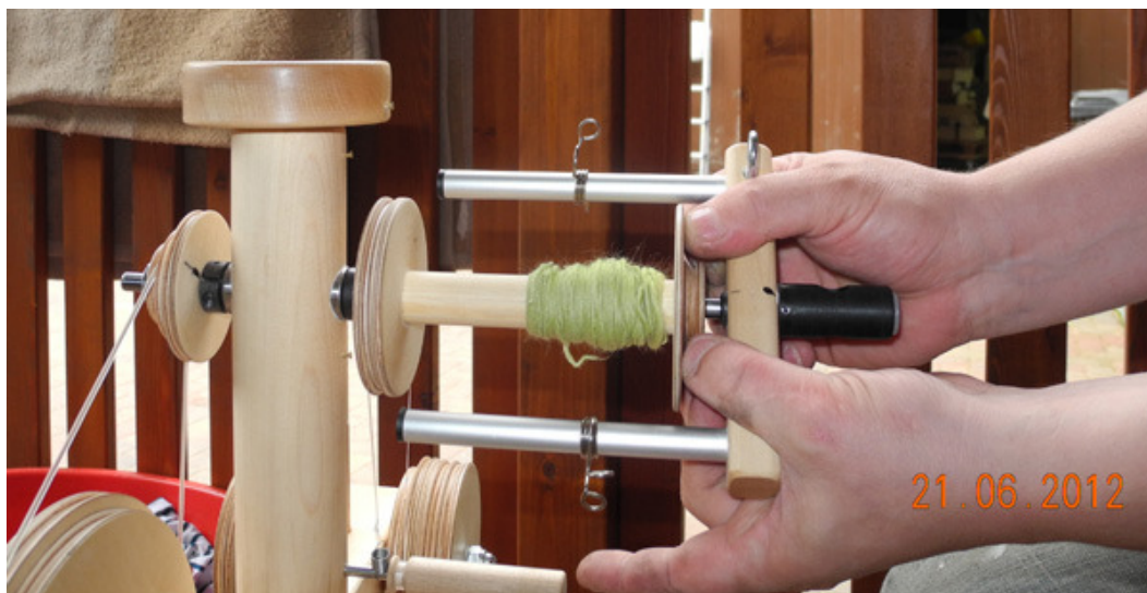
Foto: Abziehen des Flügels

Das Flügelholz wird nur gesteckt. Es ist ein Magnet in der Einzugsdüse.